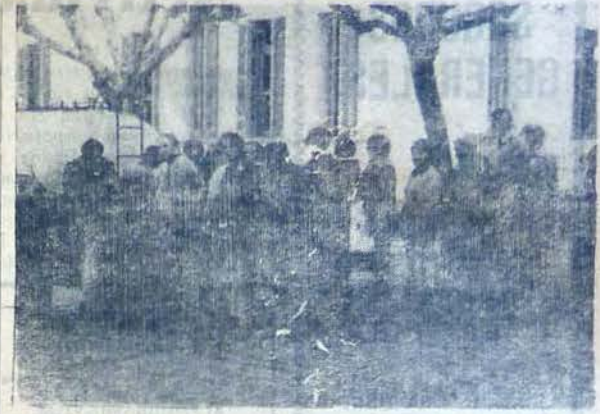
Los madrugadores, sin arredrarse ante las bajas temperaturas, obtuvieron como recompensa el preciado líquido, para ayudar a mitigar los rigores del invierno.

Es de esperar una pronta normalización del suministro pues pese a estas medidas, no se logran cubrir todas las necesidades de la población.